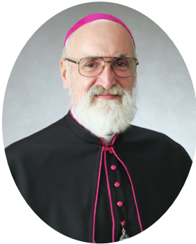
カトリック那覇教区 ウェイン・バートン司教